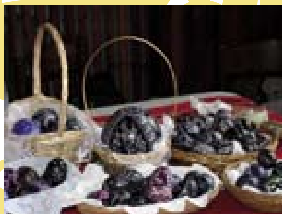
2 Z výstavy kraslic. Ratíškovice 2005 (F. Synek)