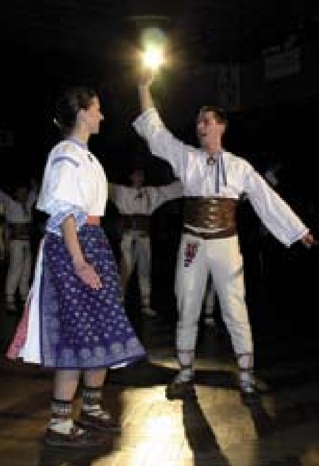
1 Tanečníci z Valaška. Žďár nad Sázavou 2005