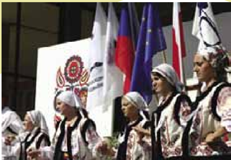
9 Soubor Balada z Moldávie. Luhačovice 2005 (F. Synek)