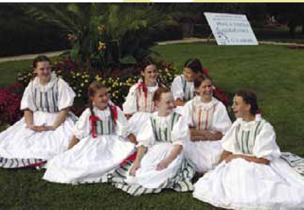
10 Děvčata souboru Úsměv Opava. Luhačovice 2005 (F. Synek)