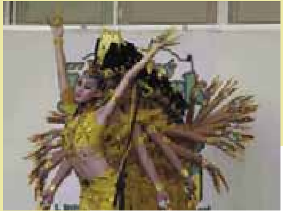
11 Dívčí skupina Shinx. Praha 2005