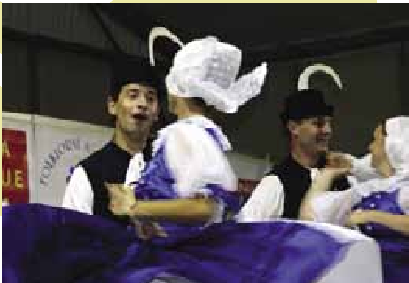
7 Taneční veselí v podání Kopaničiaru Myjava. Praha 2005