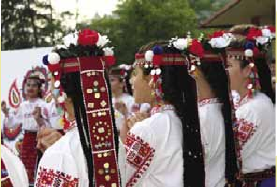
12 Bulharské kroje. Luhačovice 2005